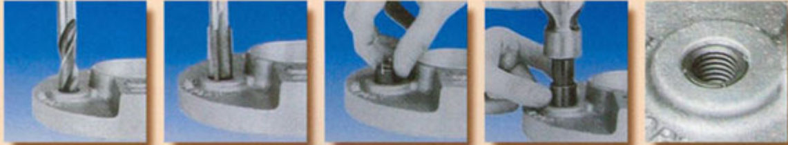
• เจาะสว่าน • ใส่วางเกลียว • หมุนเกลียวให้แน่นยิ่งขึ้น • ใช้ Clav-Sert Tool คอยขันให้แน่น • แร่นใช้งาน